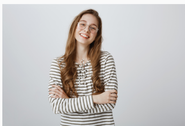
Plano médio (da cintura para cima)