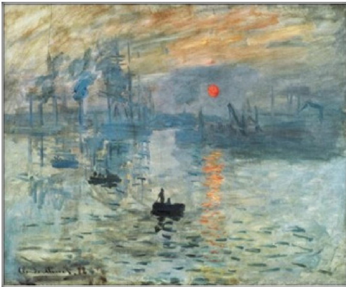
MONET, C. Impressão, nascer do sol . Óleo sobre tela. 48 × 63 cm. Museu Marmottan Monet, Paris, 1872.

APRESENTE dois aspectos da pintura Impressão, nascer do sol , de Claude Monet, que comprovem que essa obra é representativa do Impressionismo.