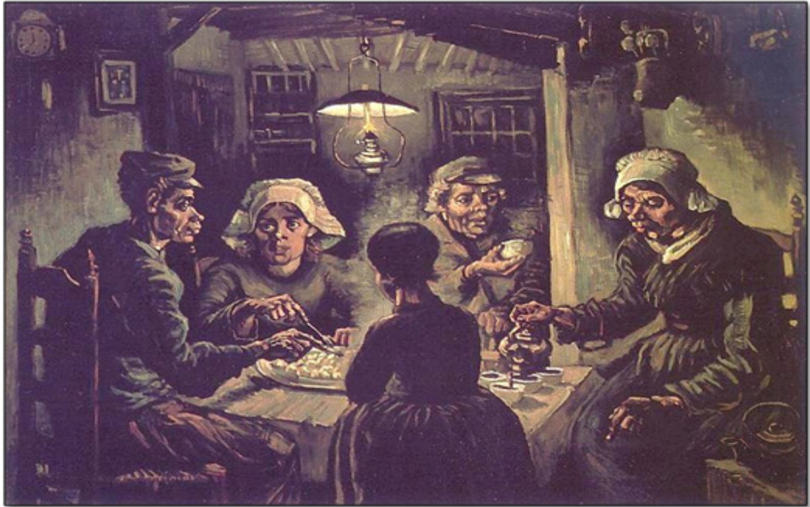
GOGH, V. Os comedores de batata. Óleo sobre tela, 82 cm x 114 cm. Museu Van Gogh. Amsterdam, 1885. In: PROENÇA, G. História da arte . São Paulo: Ática, 2014.