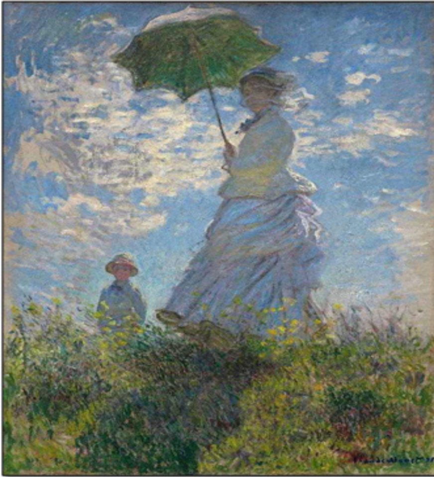
MONET, C. Mulher com sombrinha , 1875. 100 x 81cm. In: BECKETT, W. História da Pintura. São Paulo: 1997.

Em busca de maior naturalismo em suas obras e fundamentando-se em novo conceito estético, Monet, Degas, Renoir e outros artistas passaram a explorar novas formas de composição artística, que resultaram no estilo denominado Impressionismo. Observadores atentos da natureza, esses artistas passaram a