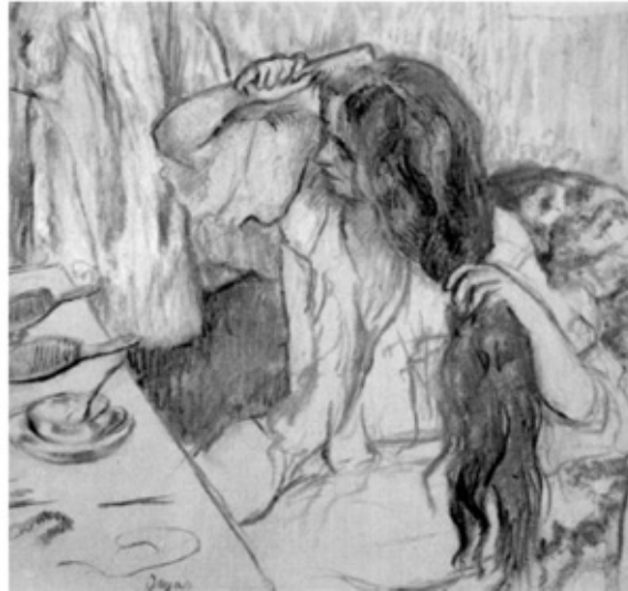
Edgar Degas, Mulher penteando seu cabelo , giz pastel sobre papel cartão, 45,76 × 43,97 cm, 1889.

16. (UEL 2017) Analise a figura e leia o texto a seguir.