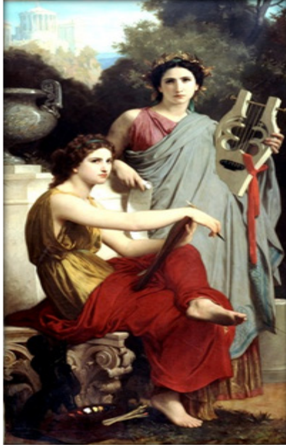
BOUGUEREAU, W. A. Arte e literatura . Óleo sobre tela, 300 x 218 cm. Museu de Orsay, Paris, França, 1867.

11. Observe a obra de arte reproduzida abaixo.