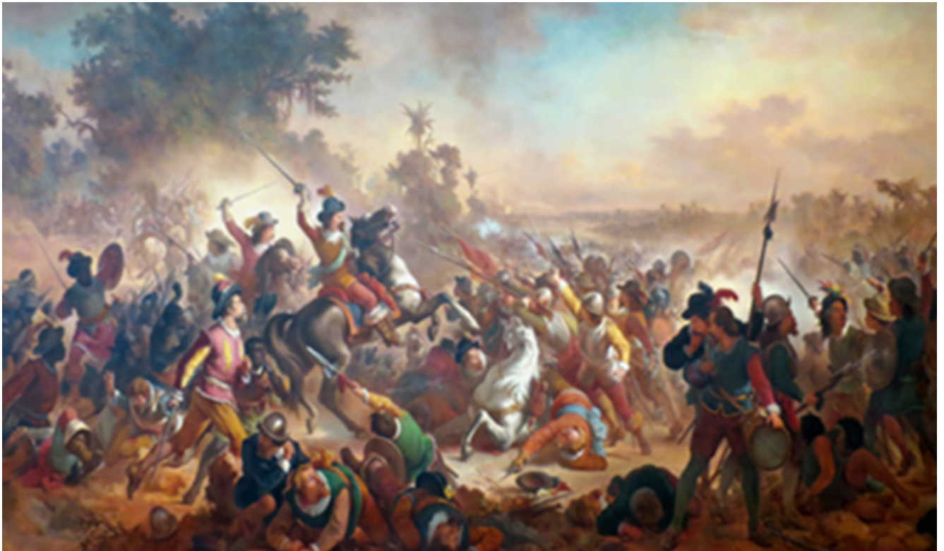
MEIRELLES, V. Batalha dos Guararapes . Óleo sobre tela, 494,5 x 923 cm. 1879. Museu Nacional de Belas Artes, Rio de Janeiro.

Pertencente ao Romantismo, a obra de Victor Meirelles caracteriza-se como uma