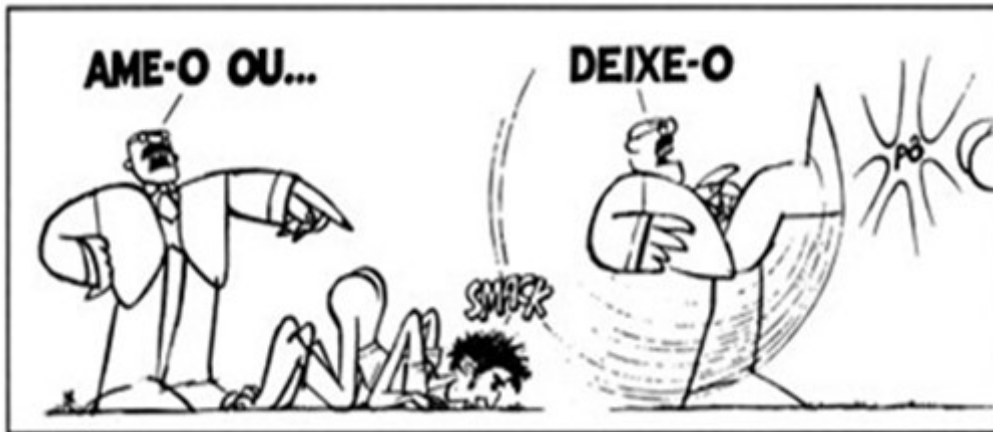
Nosso Século. São Paulo: Abril Cultural, 1980.

CONTEXTUALIZE o período histórico, a partir do slogan mostrado na charge: “Ame-o ou deixe-o”.