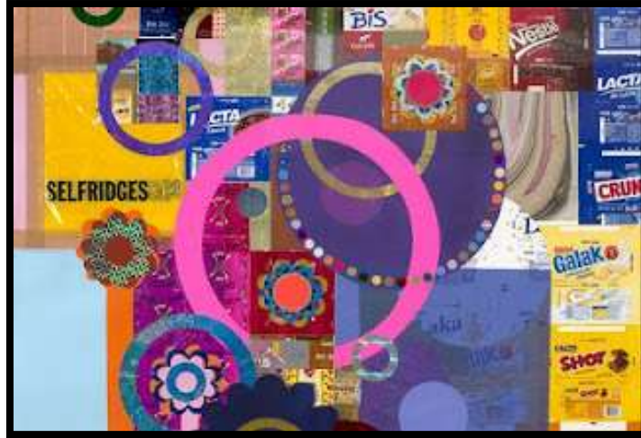
Sonho de Valsa , 2004 (detalhe).

Terceiro: por meio de colagem , como Beatriz Milhazes faz ao colar embalagens de bombom diretamente na tela.