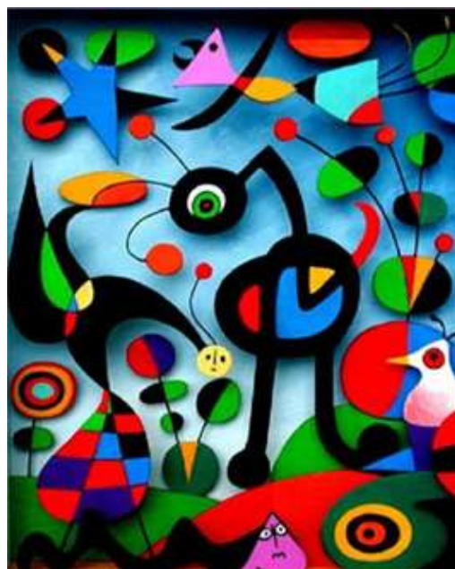
“O Jardim” multicolorido do artista Joan Miró, 1925.