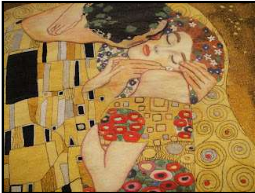
O Beijo, 1907 (detalhe).

Primeiro , utilizando formas diferentes, como Klimt faz misturando quadrados, triângulos, círculos e diferentes formas.