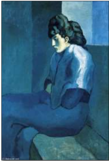
Melancolia mulher – 1902. 100 cm x 69 cm. Museu Pablo Picasso.