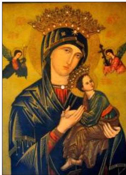
Nossa Senhora do Perpétuo Socorro – Arte Bizantina. Pintura sobre madeira com fundo em dourado

REDIJA um texto identificando as principais diferenças percebidas por você (cor, matiz, contorno e contraste) e suas impressões sobre a imagem de cada um dos períodos históricos, de acordo com o que foi estudado.