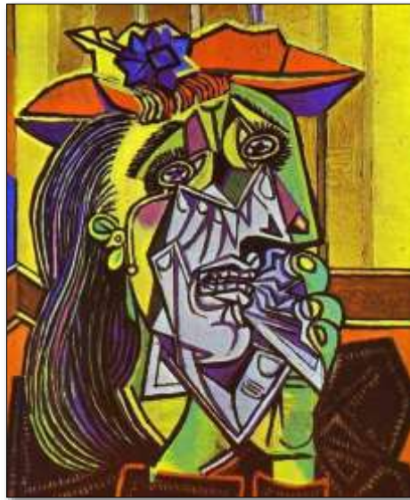
A mulher que chora – 1937. Óleo sobre tela, 60,8 x 50 cm. Tate Gallery, Londres.

Proposta: Faça uma releitura da obra de Picasso, mostrada na Imagem II (obra cubista).