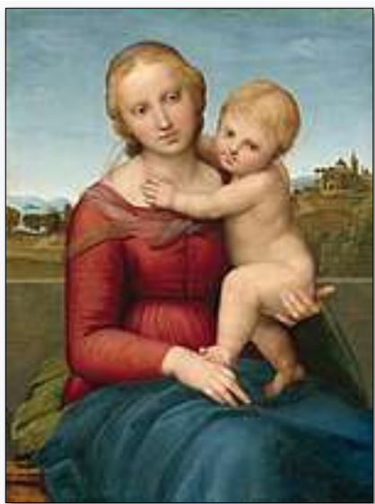
A pequena Madona Cowper c. 1505 – Arte do Renascimento Óleo sobre madeira, 58cm x 43 cm.

01. Observe abaixo a representação de figuras humanas em dois períodos distintos da história da humanidade e procure perceber as diferenças entre as duas representações.