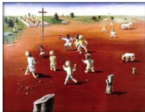
PORTINARI, Candido. Futebol . Óleo sobre tela, 97 x 130 cm, São Paulo, 1935.