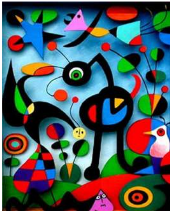
“O Jardim” multicolorido do artista Joan Miró - 1925

02. Observe a obra de Joan Miró a seguir.