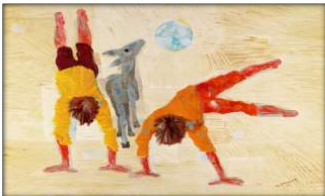
PORTINARI, Candido. Meninos Brincando . Óleo sobre tela, 60 x 72 cm, São Paulo, 1955.