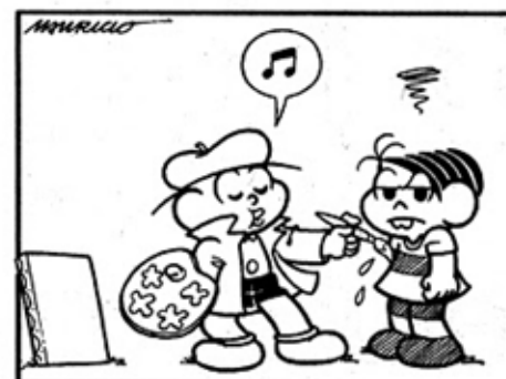
SOUSA, Mauricio de. Turma da Mônica. Disponível em: http://turmadamonica.uol.com.br/tirinhas/ . Acesso em: 15 abr. 2021.

Pode-se afirmar que a personagem Mônica interpretou a frase “Posso te pintar?”, nessa tira, corretamente? JUSTIFIQUE a sua resposta.