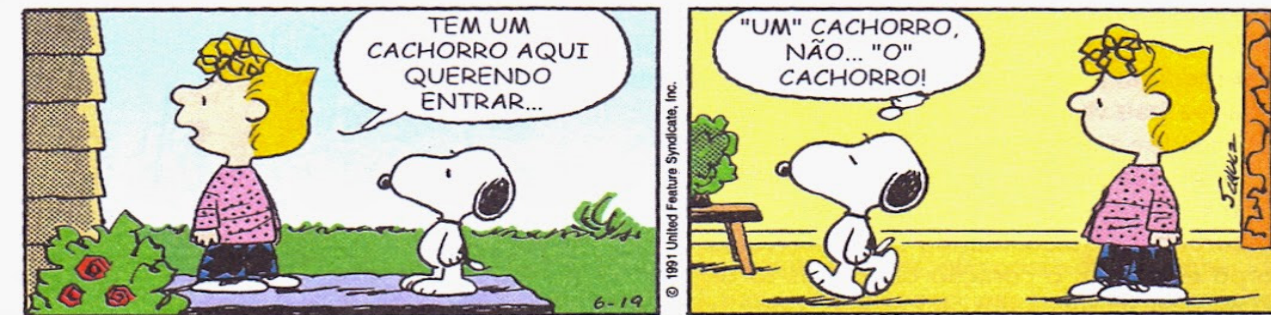
SCHULZ, Charles M. Snoopy. Jornal da Tarde, São Paulo, 29 ago. 2003.

Artigos são palavras que antecedem os substantivos, definindo-os ou indefinindo-os, particularizando-os ou generalizando-os.