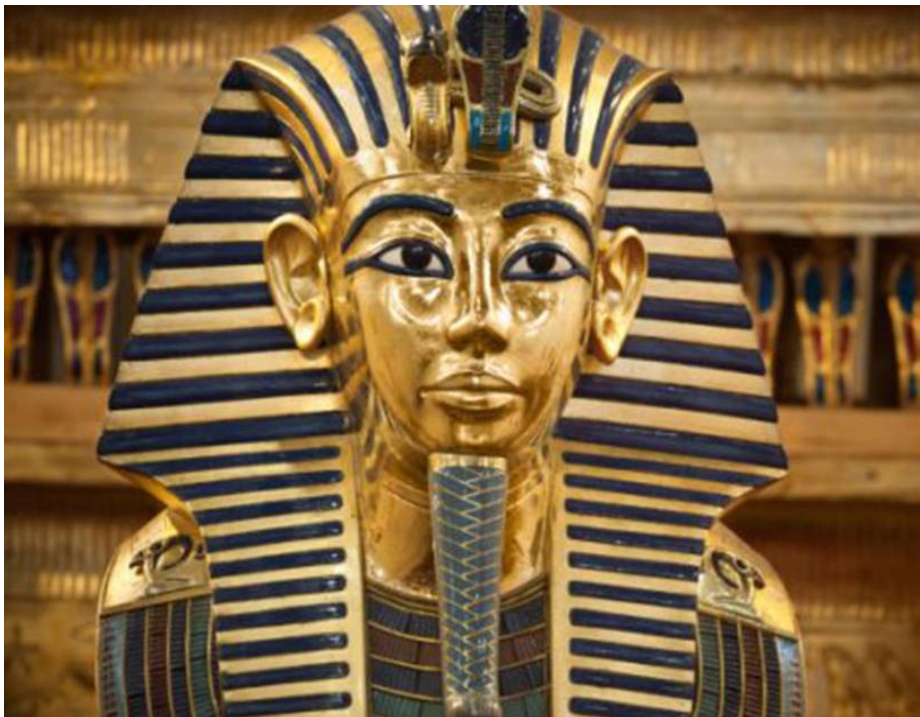
Máscara funerária de Tutancâmon

07. Observe a fotografia da máscara funerária do faraó Tutancâmon.