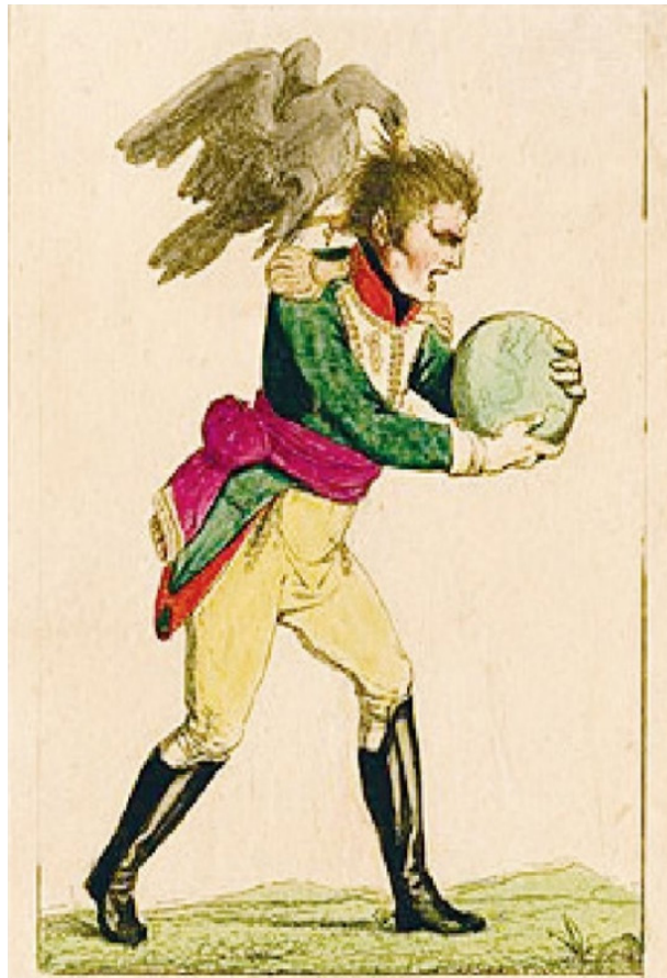
Caricatura de Napoleão Bonaparte, 1814 (Adaptado de britishmuseum.org). Disponível em: https://bit.ly/3zWitTE . Acesso em: 28 jul. 2021.

a) ANALISE o contexto histórico que contribuiu para a ascensão de Napoleão Bonaparte ao poder.