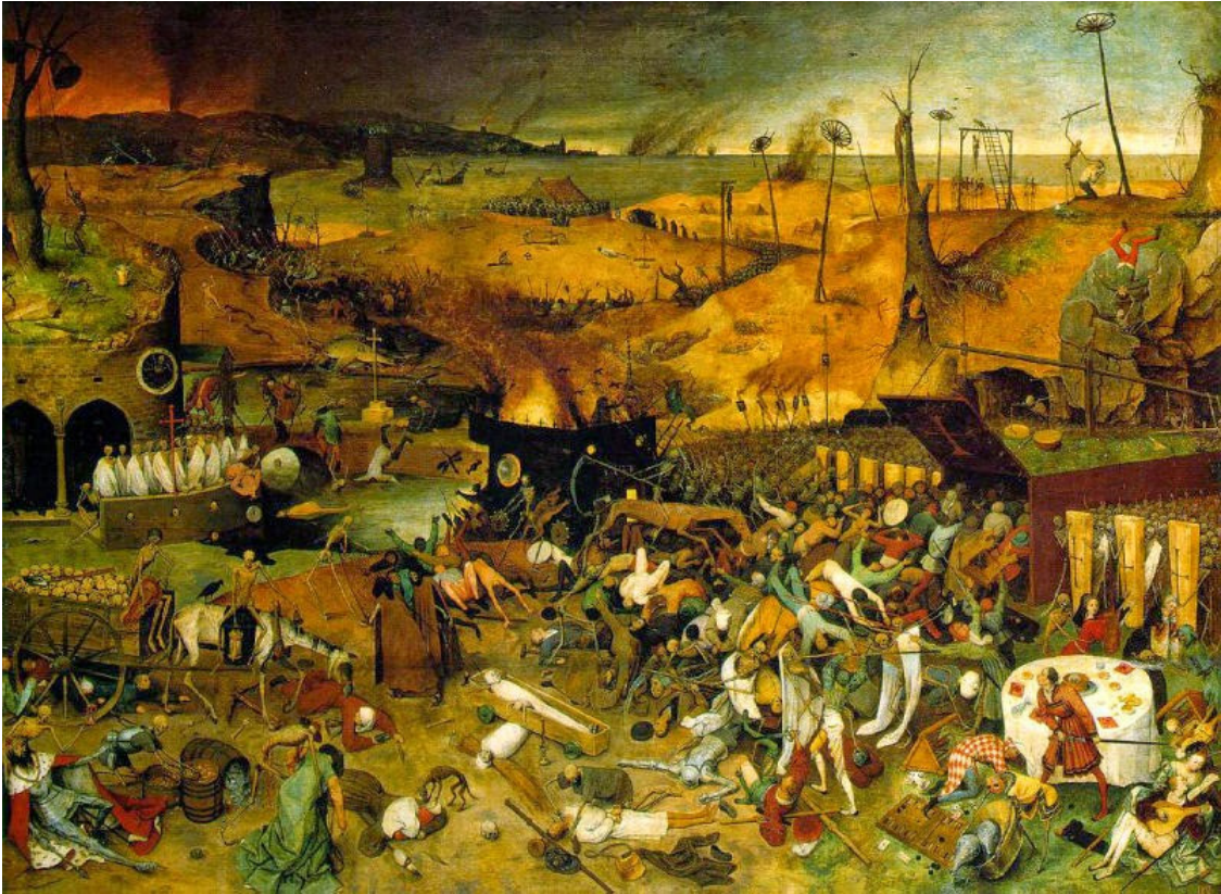
BRUEGEL, Pieter. O Triunfo da Morte . c.1562. Pintura a óleo no painel, 117 x 162 cm. Museu do Prado, Madrid.

A obra de Bruegel, O Triunfo da Morte , faz referência a alguns acontecimentos da crise da Idade Média no século XIV.