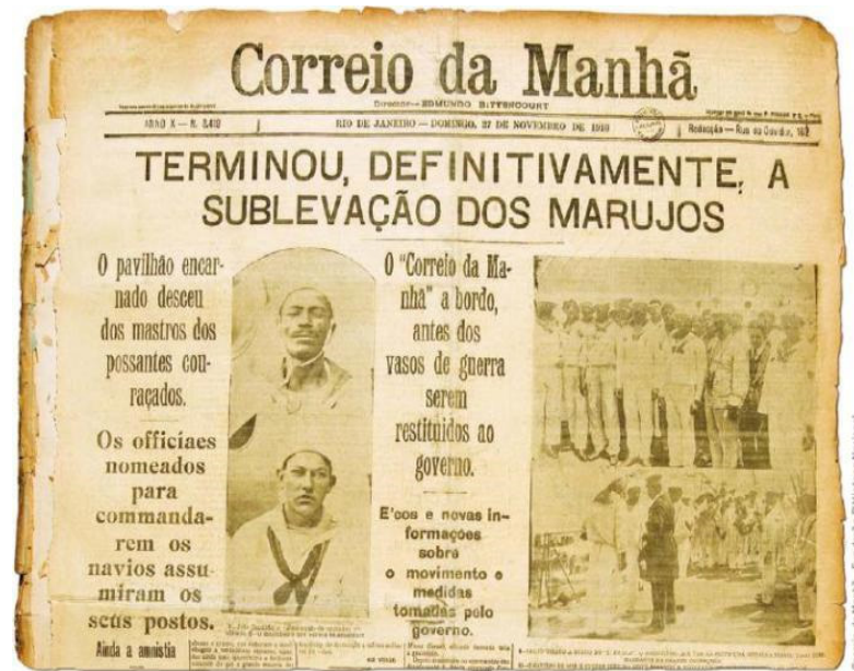
Correio da Manhã , AnoX.N.8410. 27 nov. 1910. Disponível em: https://bit.ly/3rLjwTx . Acesso em: 28 jul.2021.

06. Leia a capa do jornal Correio da Manhã , de 27 de novembro de 1910.