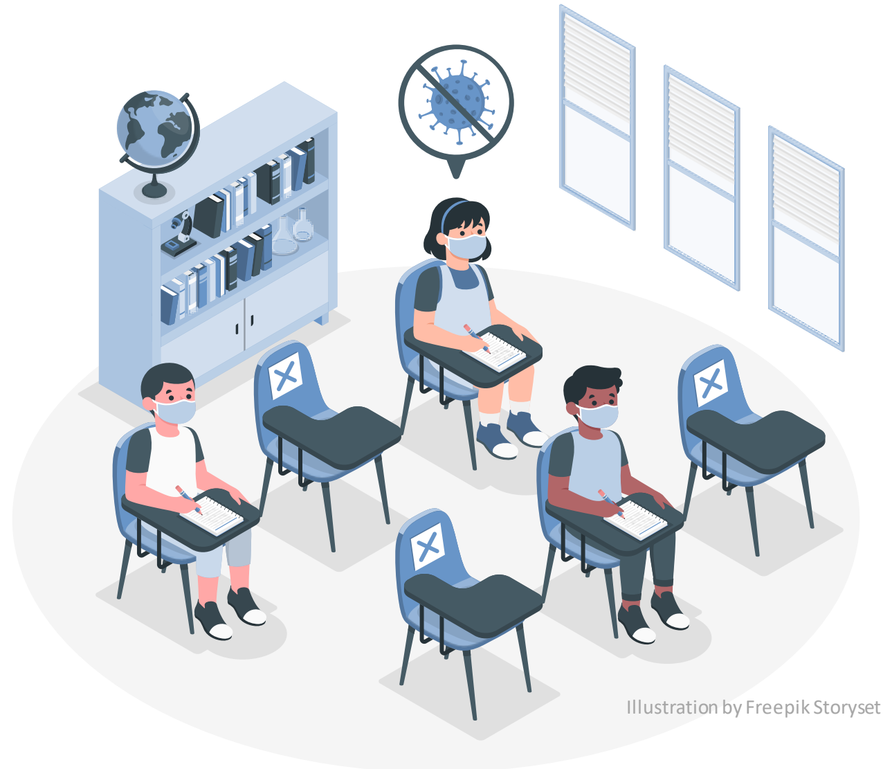
Illustration by Freepik Storyset