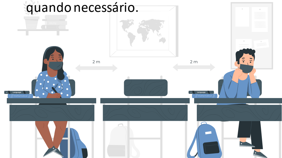
Illustration by Freepik Storyset