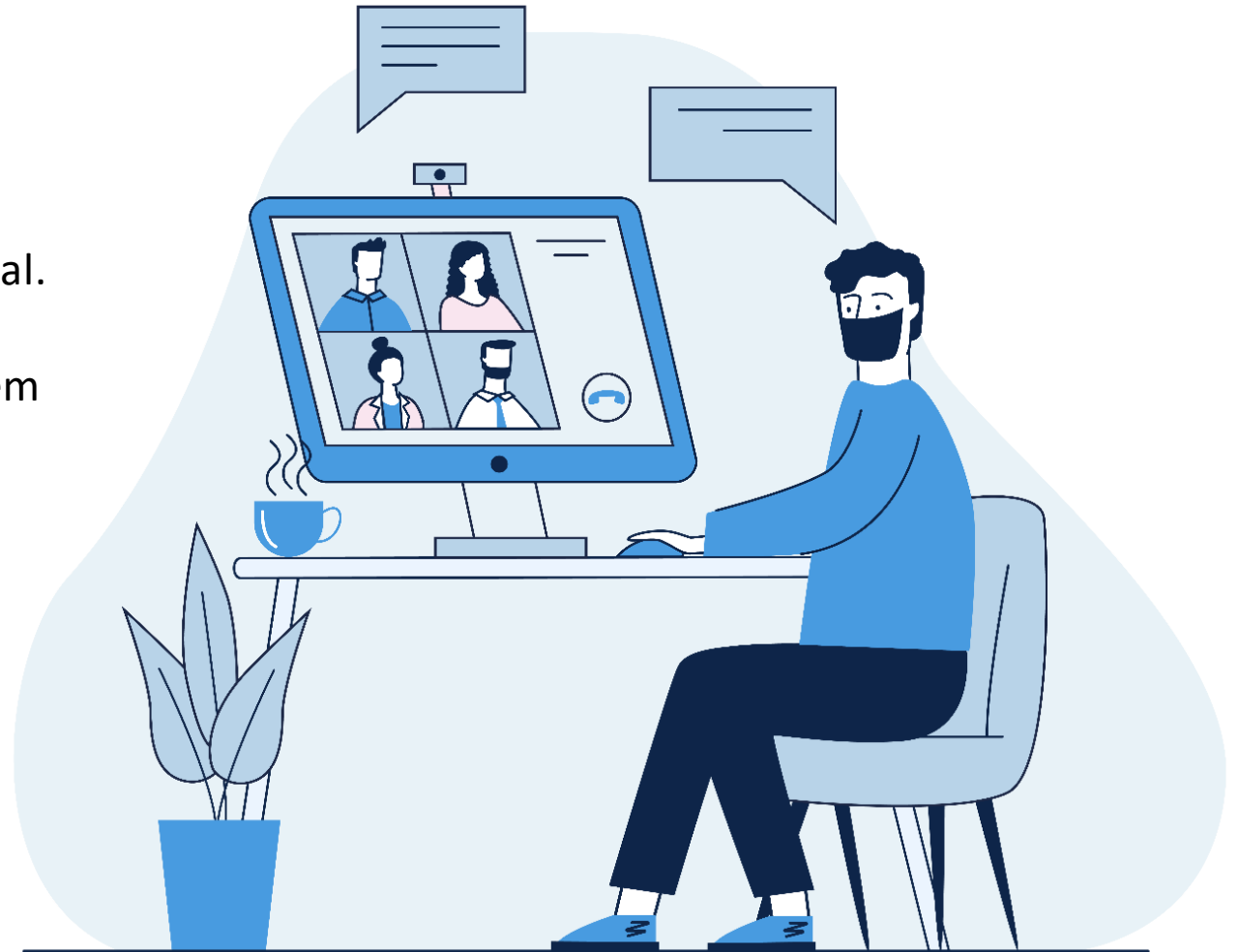
Illustration by Freepik Storyset