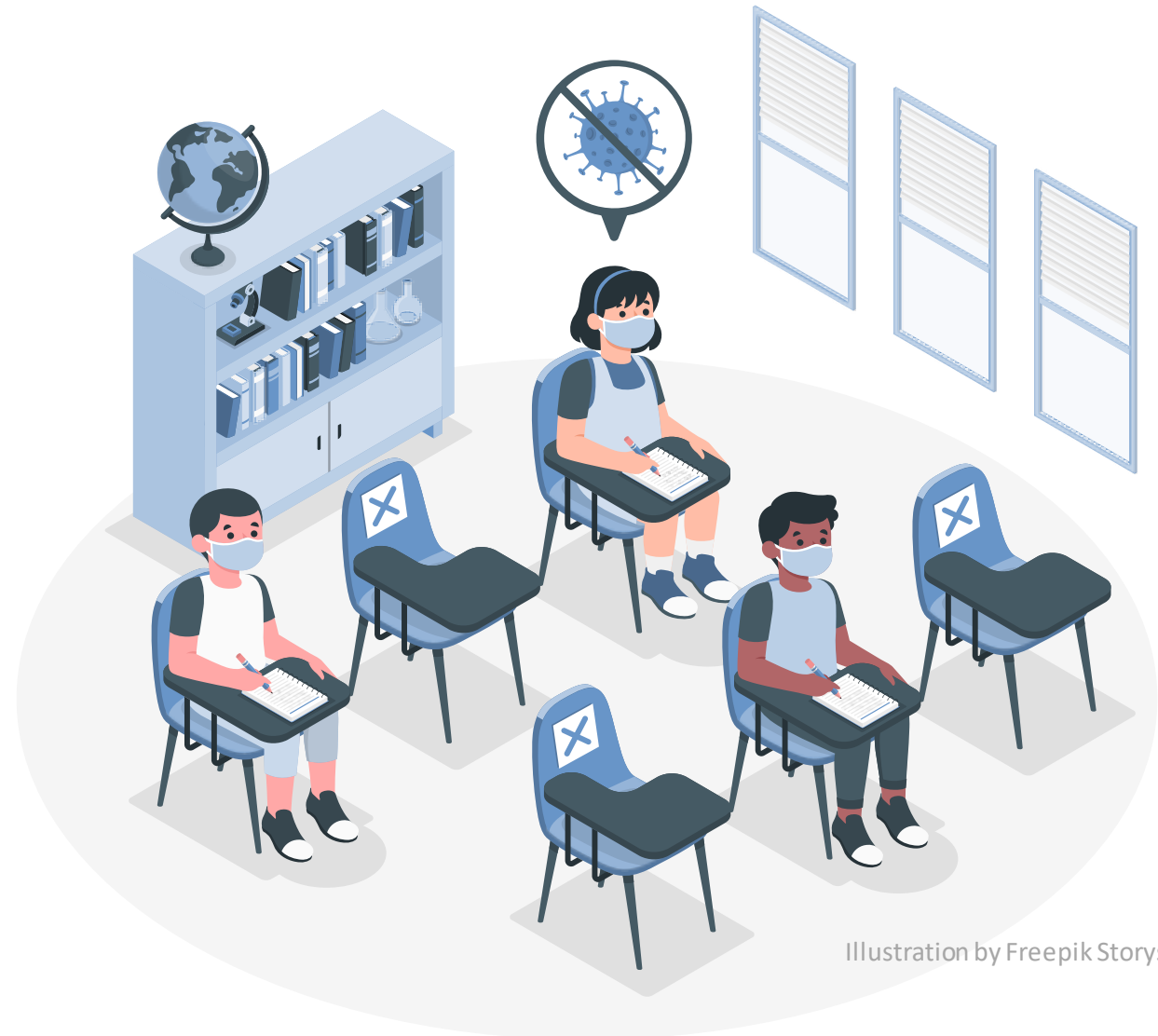
Illustration by Freepik Storyset