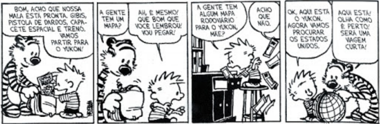
WATTERSON, BILL. Calvin e Haroldo: Yukon ho! São Paulo: Conrad, 2008.