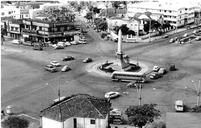
Praça Sete, 1963

01. Observe as imagens a seguir, que mostram a Praça Sete, em Belo Horizonte, em diferentes tempos.