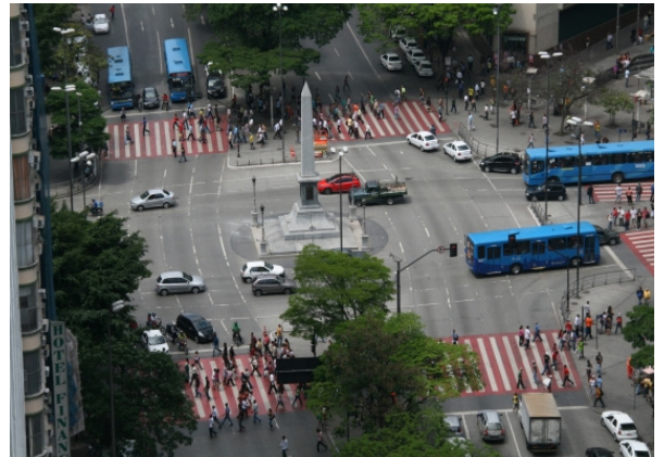
Praça Sete, 2019.

a) CITE duas mudanças que ocorreram, com o passar do tempo, na Praça Sete.