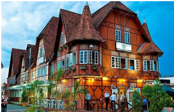
Cidade de Blumenau, 2019 – Brasil

b) ESCREVA , no quadro ao lado, qual é a influência cultural dos migrantes mostrada nesta imagem.