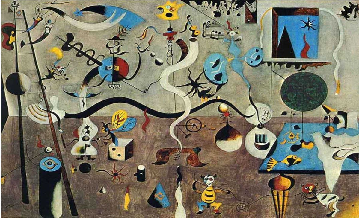
MIRÓ, Joan. O Carnaval do Arlequim , 1925. Óleo sobre tela, 66 x 93 cm. Albright-Knox Art Gallery, Buffalo, Nova York.

02. Observe abaixo a obra pictórica de Joan Miró.