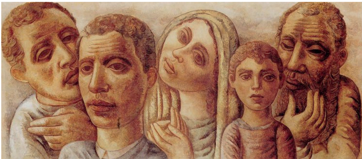
SEGALL, Lasar. Emigrantes III , 1936. Areia e óleo sobre tela, 86 x 197,7. Acervo da Pinacoteca do Estado de São Paulo.

A arte pode suscitar sentimentos, mas também pode denunciar, negar, representar, explicitar, construir algo, entre outras funções.