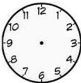
Saída do voo

MARQUE , nos relógios abaixo, os horários.