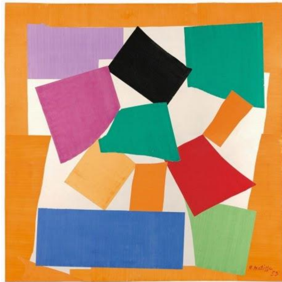
MATISSE, Henri. O Caracol , 1952-1953. Colagem, 2,87 m x 2,88 m. Tate Modern, Londres.

Henri Matisse participou da exposição mais abrangente já dedicada aos recortes/colagens de papel do artista, reunindo cerca de 130 obras, feitas entre 1937 e 1954.