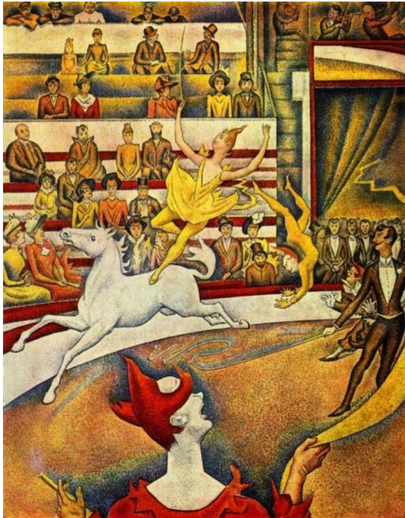
SEURAT, Georges. O Circo , 1890-1891. Óleo sobre tela, 1,85 m x 1,52 m. Museu de Orsay, Paris.

Observe a tela O Circo , pintura feita por Georges Seurat.