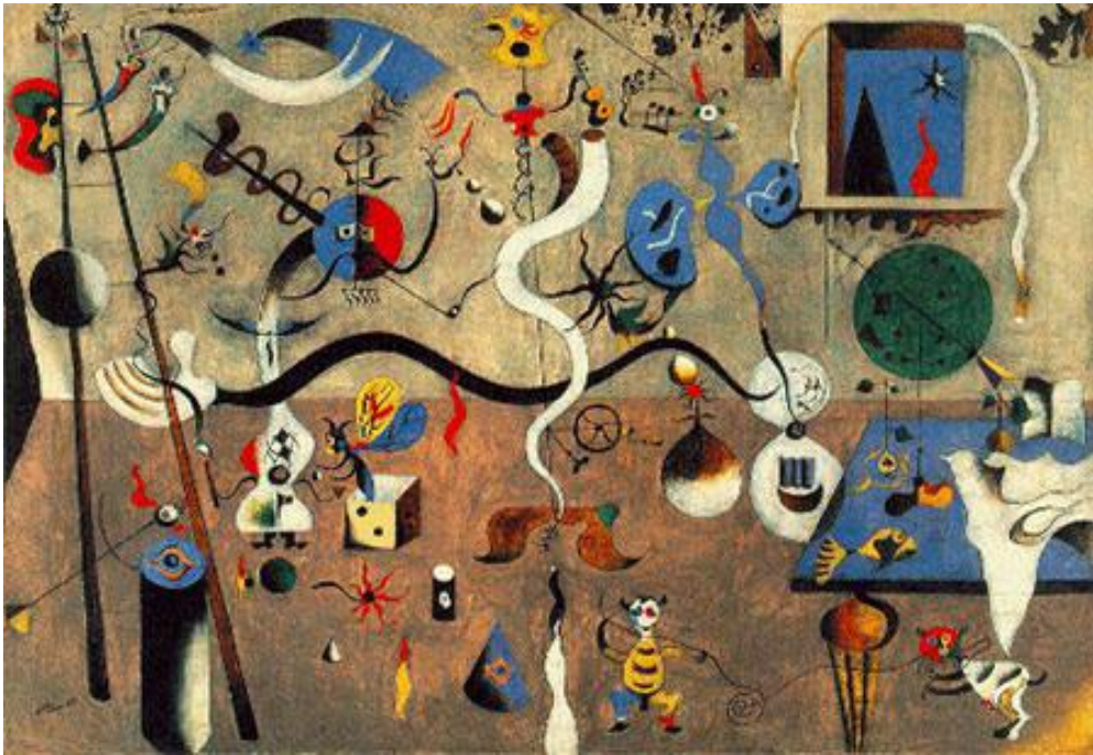
MIRÓ, Joan. Carnaval de Arlequim , 1924-1925. Óleo sobre tela, 66 cm x 93 cm. Albright-Knox Art Gallery, Nova Iorque.

02. Observe a tela pintada por Joan Miró com diversos pontos, linhas, formas e cores.