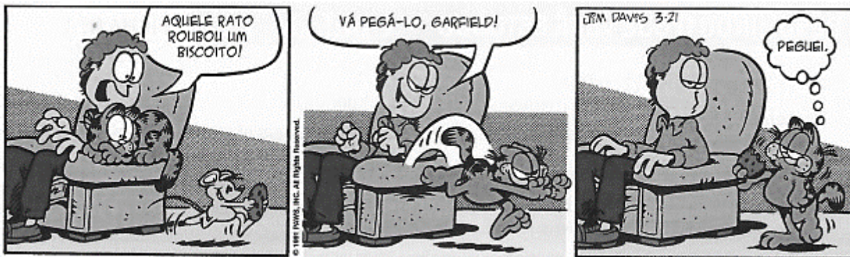
Jim Davis, Garfield .