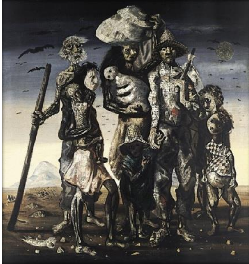
PORTINARI, Candido. Retirantes . Óleo sobre tela, 180 x 190 cm. Museu de Arte de São Paulo, São Paulo, 1944.