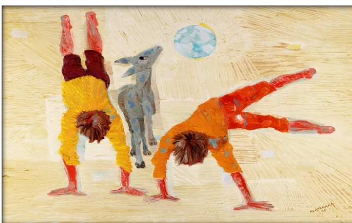
PORTINARI, Candido. Meninos Brincando . Óleo sobre tela, 60 x 72 cm, São Paulo, 1955.

Observe as imagens a seguir, que mostram pinturas de Cândido Portinari