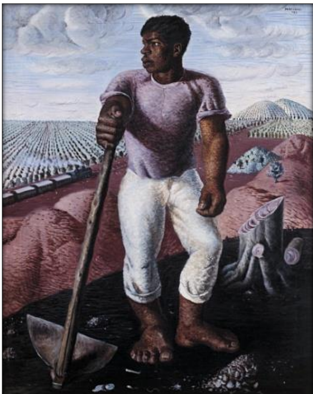
PORTINARI, Cândido. O lavrador de café. Óleo sobre tela, 100 x 81 cm. Museu de Arte de São Paulo, São Paulo, 1934.

Observe as imagens, que mostram pinturas de Cândido Portinari.