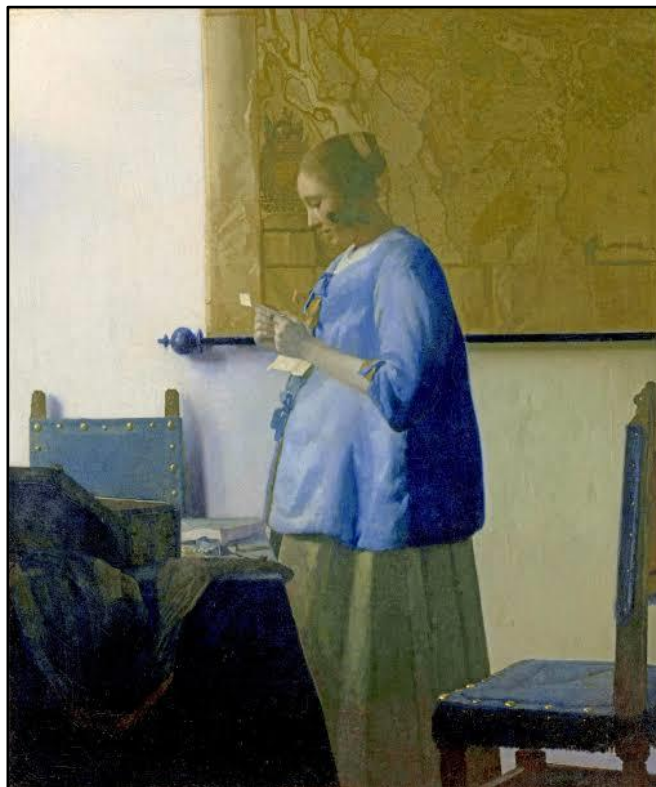
VERMEER. Mulher de azul lendo uma carta. Óleo sobre tela, 620 X 743 cm. Museu do Louvre, França, 1669-1670.