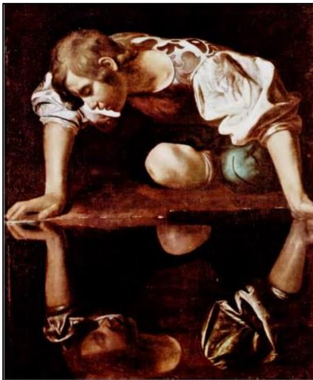
CARAVAGGIO, Narciso . Óleo sobre tela, 110 x 92 cm. Galeria Nacional de Arte Antiga, Roma, Itália, 1599.