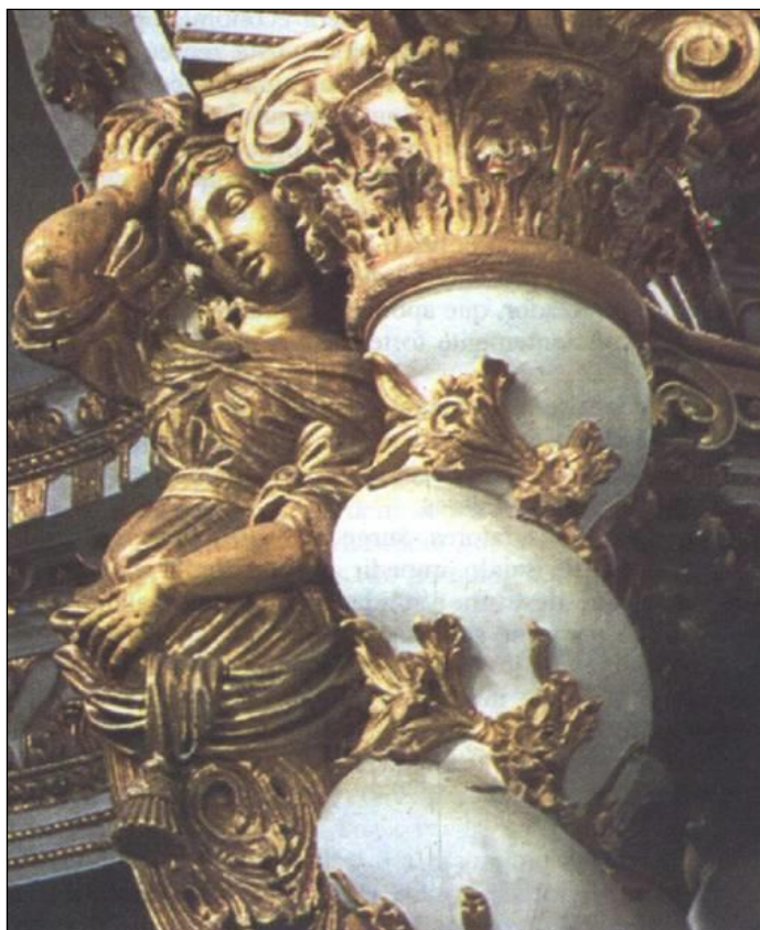
Detalhe da capela-mor do convento de Nossa Senhora da Lapa, em Salvador.

a) IDENTIFIQUE duas características do Barroco nesse detalhe da capela-mor do convento de Nossa Senhora da Lapa.