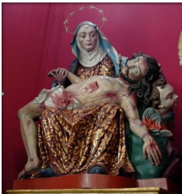
Imagem de Nossa Senhora da Piedade, de Antônio Francisco Lisboa Santuário Basílica Nossa Senhora de Piedade – MG.

b) Observe a escultura mostrada na imagem a seguir.