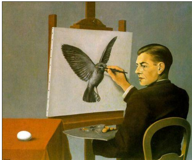
MAGRITTE, René. Clarividência . Óleo sobre tela, 54,5 cm x 65,5 cm. Coleção particular, 1936.

IDENTIFIQUE a função da linguagem que predomina nessa obra de Magritte. JUSTIFIQUE sua resposta.