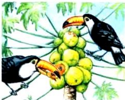
Tucano. Alimenta-se de frutos.