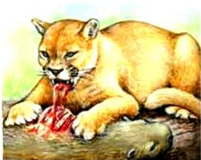
Onça-parda. Alimenta-se de outros animais.

03. Observe as imagens e leia as informações a seguir.