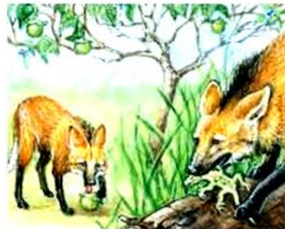
Lobo-guará. Alimenta-se de pequenos animais e frutos.

a) Qual dos animais mostrados acima é um animal herbívoro?