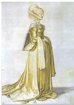
DÜRER, Albrecht. Uma senhora de Nuremberg em traje de baile , 1500. Aquarela sobre papel, 32,5 x 21,8 cm. Museu Abertina, Viena, Áustria.

b) EXPLIQUE de que modo Dürer, na obra Uma senhora de Nuremberg em traje de baile , aproxima arte e realidade.