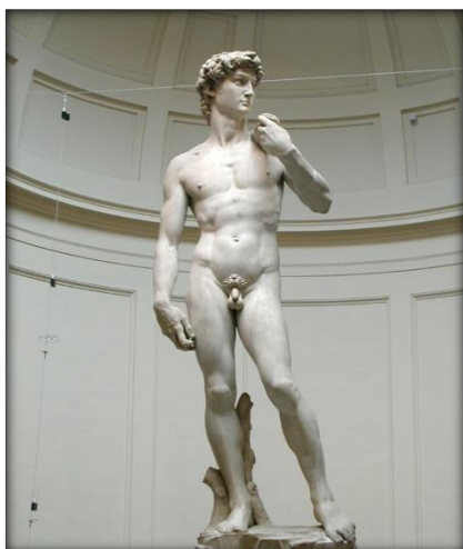
BUONARROTI, Michelangelo. Davi , c. 1501-1504. Escultura de mármore, 4,10 m. Galeria da Academia de Belas Artes, Florença, Itália.

01. Observe abaixo as obras de Michelangelo Buonarroti.