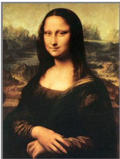
DA VINCI, Leonardo. Mona Lisa , 1503-1506. Óleo sobre madeira, 77 x 53 cm. Museu do Louvre, Paris, França.

Analise as imagens abaixo e responda às questões 02 e 03 .