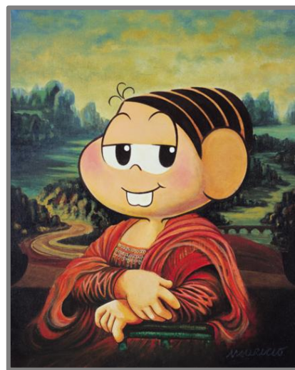
SOUSA, Mauricio de. Mônica Lisa . Desenho publicado no livro Histórias em quadrões , s.d.

02. a) IDENTIFIQUE duas características da pintura renascentista na Mona Lisa , de Leonardo da Vinci.