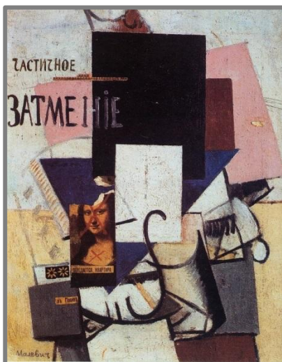
MALEVICH, Kazimir. Composição com Mona Lisa , 1914. Óleo sobre tela, colagem, 62 x 49,5 cm. Museu Estatal Russo, São Petersburgo.