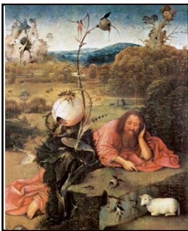
BOSCH, Hieronymus. São João Batista no deserto , 1489. Óleo sobre madeira, 49 x 40,5 cm. Museu Lázaro Galdiano, Madri, Espanha.

a) Como podemos identificar a força da imaginação e da fantasia na obra São João Batista no deserto , de Hieronymus Bosch?