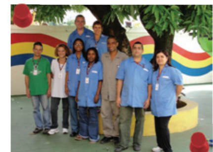
Zeladores e zeladoras do colégio

O zelador na escola é pessoa fundamental para que cada detalhe, cada cantinho esteja adequado para a recepção dos alunos e de todos que cuidam deles. Aos zeladores e zeladoras o nosso muito obrigado!