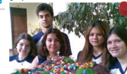
Maquete: Favela da Rocinha, Rio de Janeiro.