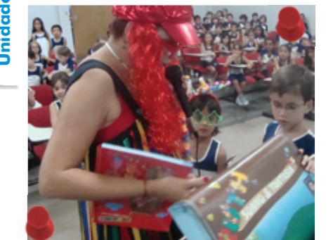
Visita da Fada Tílica à turma do 1º Ano/EF

Com os olhinhos atentos e curiosos, típico de quem já se comunica bem com os adultos e está cheio de expectativas, os alunos do 1º ano/EF do Colégio Espanhol Santa Maria receberam uma visita mágica no auditório da Unidade: a fada Tílica, que veio para entregar o livro "Sim Salabim - O Mundo Mágico das Letras". Ao final da apresentação, houve palmas, sorrisos e a certeza de que muitas aventuras os esperam ao longo desta fase da alfabetização!