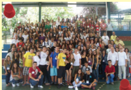
Alunos (3º Ano/EM), professores e funcionários que participaram do encontro

Aconteceu no dia 27 de fevereiro de 2010, sábado, na parte da manhã, o ENCONTRO DE FORMAÇÃO 2010, envolvendo alunos do 3º Ano/EM e professores das Unidades do Colégio Santa Maria. O tema foi "O DIÁLOGO NO RELACIONAMENTO INTERPESSOAL (O ADOLESCENTE E A FAMÍLIA)".